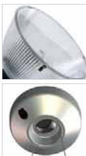
Diffusore di protezione.